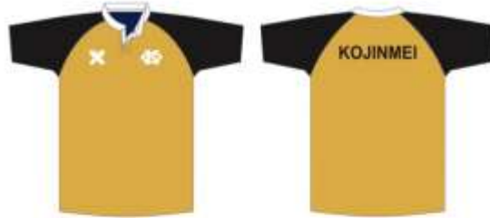
スクール生 リバーシブル 表