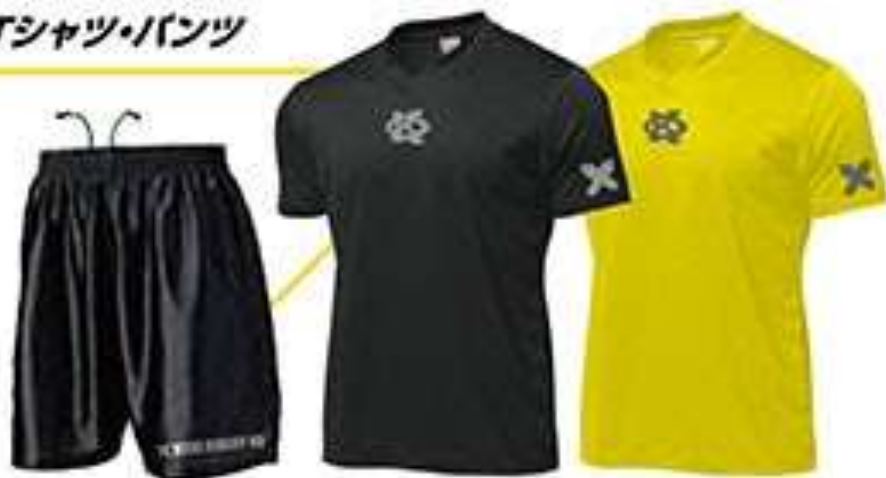
ドライテック Tシャツ・パンツ