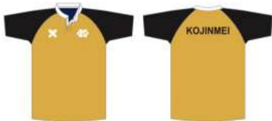
スクール生 リバーシブル 表